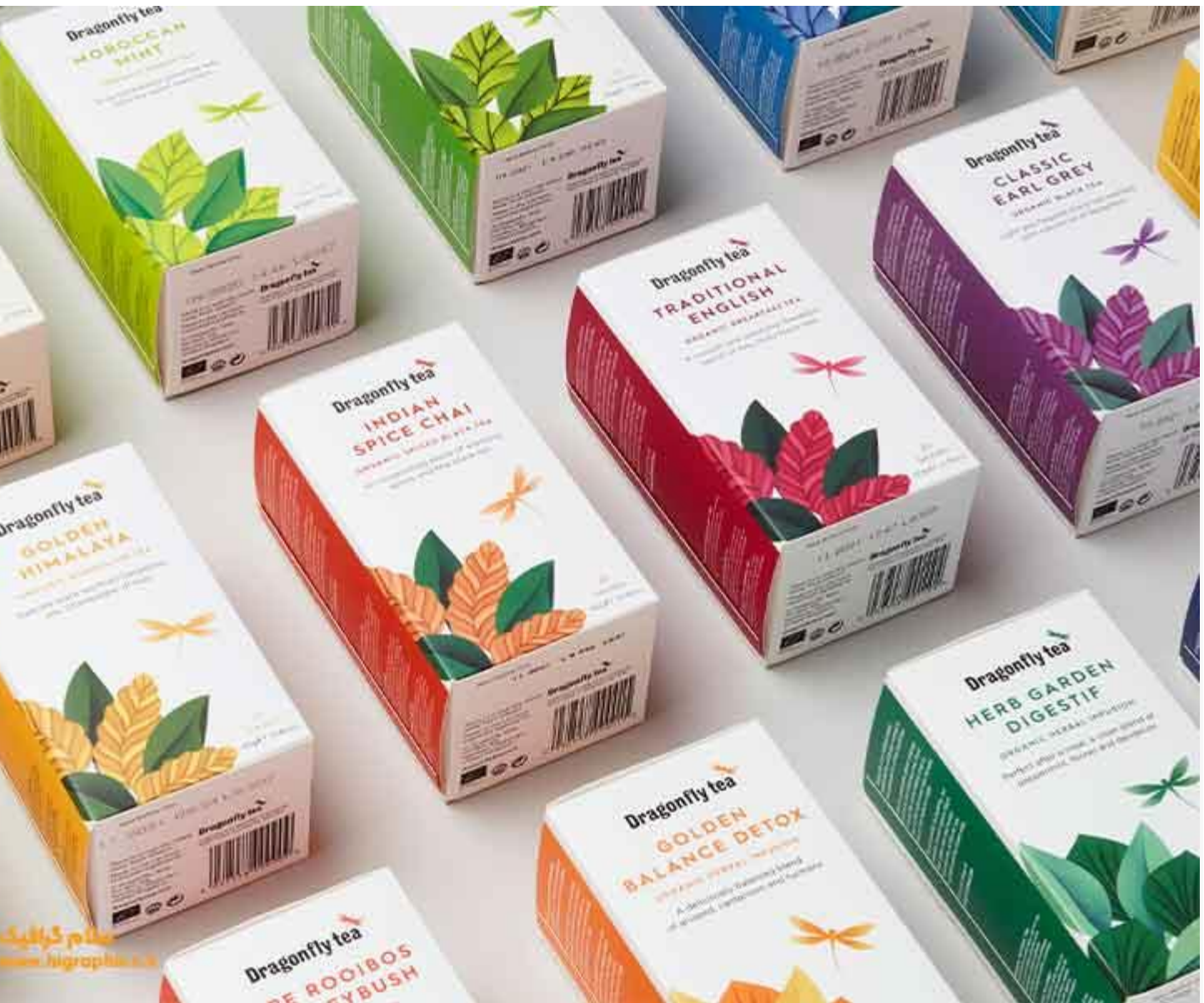
بهترین شرکت بسته بندی